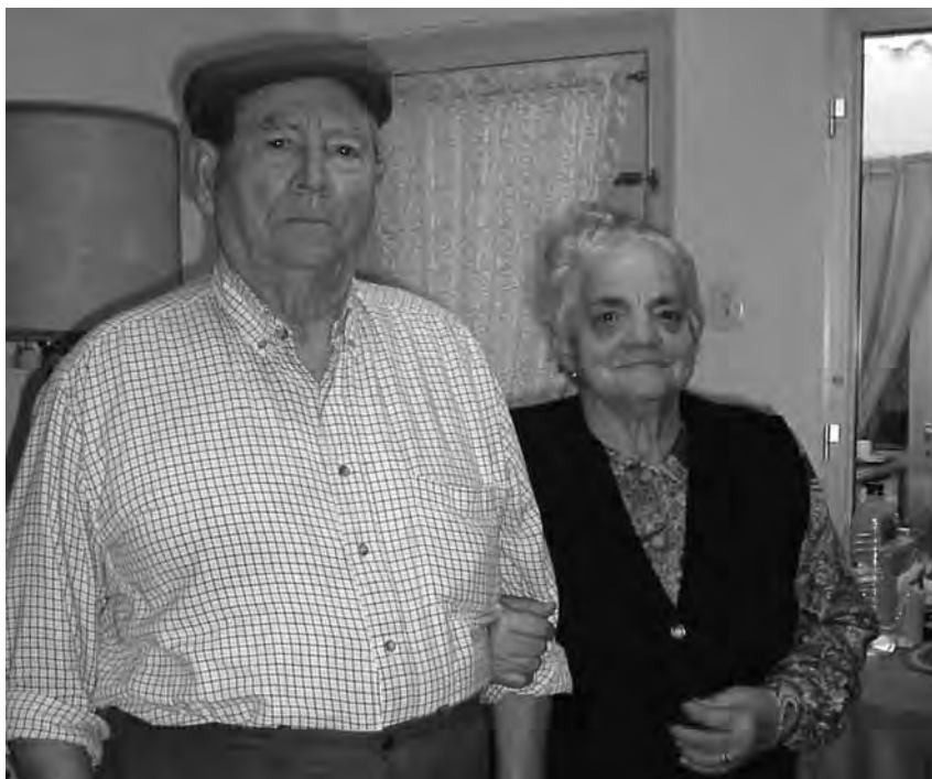
Fotografía actual del matrimonio de barqueros.